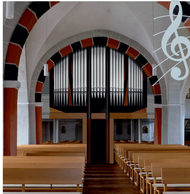
Simulation der neuen Orgel