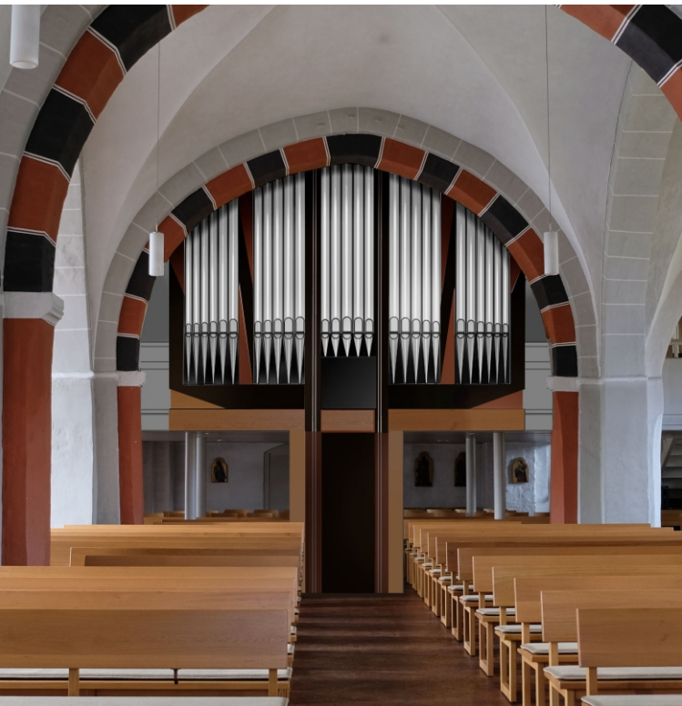
Simulation der neuen Orgel